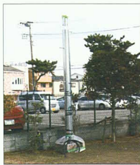
鵜沼市民センターに増設中の防災行政無線子局