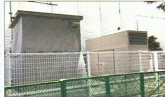
非常用自家発電設備

災害発生時に災害対策本部と地域防災拠点本部との間で情報伝達をする移動系防災行政無線、MCA無線、衛生携帯電話、TV会議システムや、夜間の一部照明、被害集計用のパソコン等の電力を確保するために自家発電設備を設置しています。市内の市民センター・公民館に順次設置され、鵜沼は23年度中に完成する予定です。自家発電設備の規模は50KVAで必要最低限の電気使用において、概ね3日間使用できる規模です。