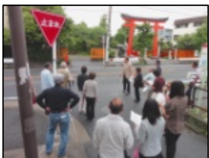
「鶴沼を知る」で現場説明 (1943年に創建された鶴沼伏見稲荷神社)

来年5月の卒業までにどんな提案が生まれ、どんな活躍の場が広がるのか期待も広がっています。