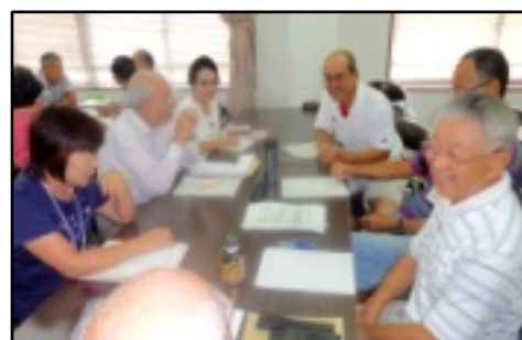
鶴沼の「地域福祉」の課題についてグループ討議