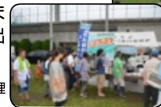
大勢の来場者で賑わう鶴沼運動公園