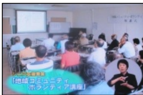
J-COM湘南の藤沢市広報番組でも紹介