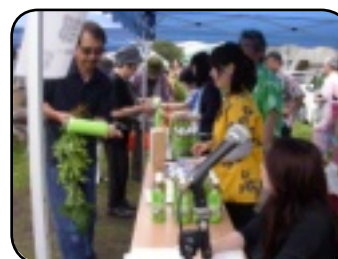
熱い期待の抽選会