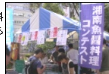
魚醬に興味を示す来場者