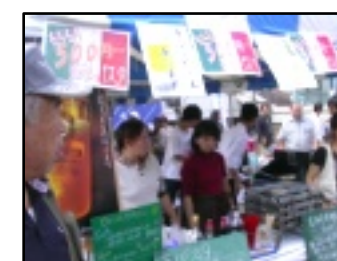
明るい声の出店風景